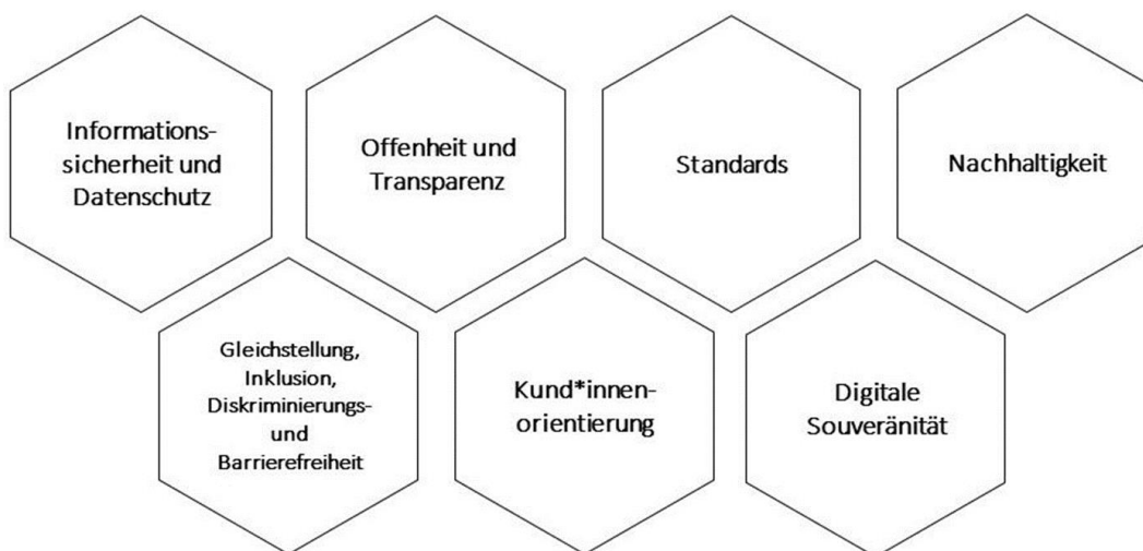
Abbildung 03: Strategische Prinzipien der Digitalisierung

Bei der Gestaltung und Umsetzung der IT-Strategie richtet das RIT sein Handeln an den strategischen Prinzipien der Digitalisierungsstrategie aus (vgl. Abbildung 03 bzw. siehe SV 20-26 / V 11838). Sie bilden als grundsätzliche Leitlinien das Fundament für die Digitalisierung und die IT-Strategie und sind bei der Formulierung von Zielen und Maßnahmen berücksichtigt worden. Detaillierte Informationen zu den Prinzipien zu finden im Digitalradar der LHM unter https://muenchen.digital/strategie.html .