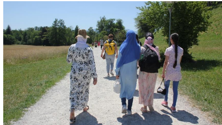
Sommerausflug am Chiemsee

mit gemeinsamem Picknick bekamen wir eine charmante Führung durch das Märchenschloss König Ludwigs II, Herrsching am Chiemsee.