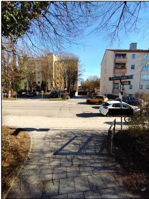
Abbildung 1: Einmündungsbereich Gerastr. in die Feldmochinger Str., Blickrichtung Ost