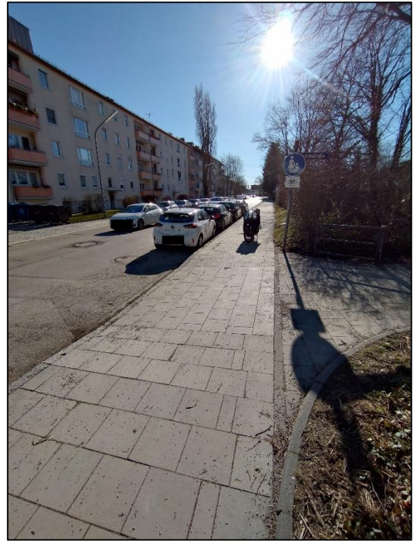
Abbildung 2: Einmündungsbereich Gerastr. in die Feldmochinger Str., Blickrichtung Nord