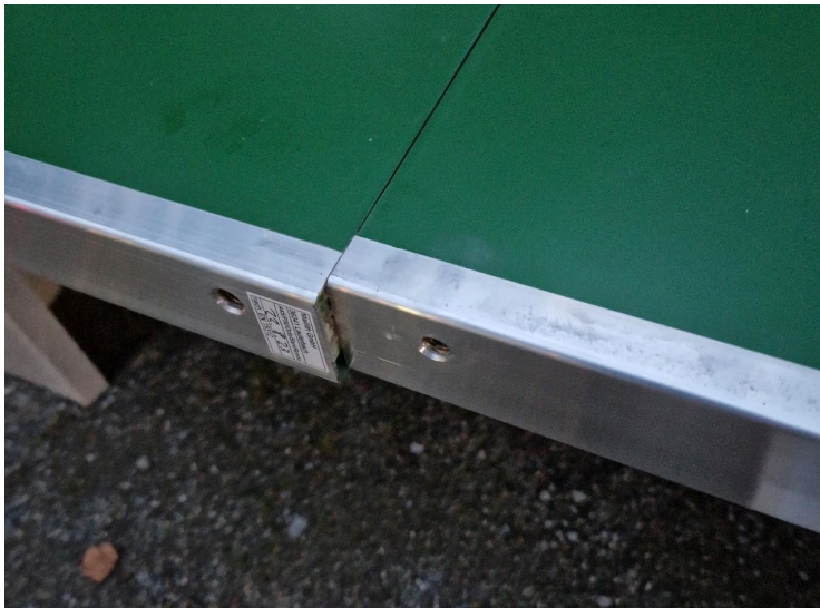
Aufnahme 2: Versatz