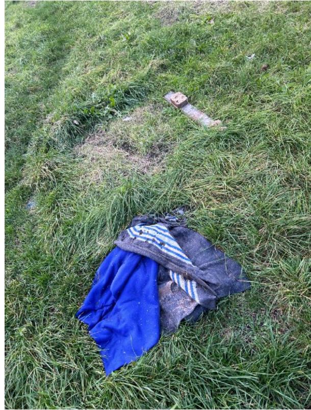
Gesammelte Bretter und Klötze mit Größenvergleich und schmutzige Kleidung