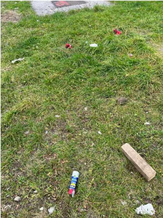
Grober Müll und Schmieröldose