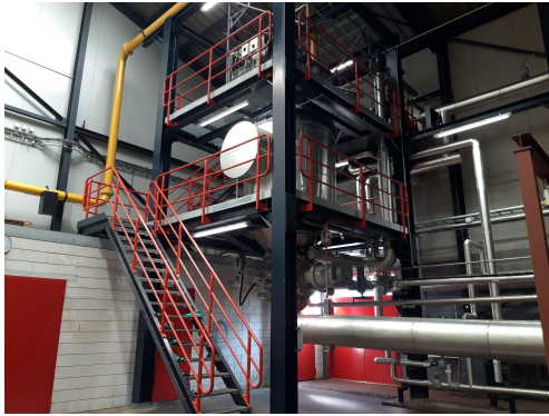
Abbildung 1: Beispielhafte Windelrecycling-Anlage in Nijmegen 3

In Münchens Restmüll befinden sich ca. 10 % Hygieneprodukte (Windeln und Hygienepapier). Dies entspricht ca. 30.000 Tonnen pro Jahr. Nach Angaben des Bundesministeriums für Umwelt, Naturschutz, nukleare Sicherheit und Verbraucherschutz (BMUV) verbraucht ein Kind in der gesamten Wickelphase etwa 5.000 Windeln. Das entspricht ca. 10 Millionen Windeln pro Tag in Deutschland. 4 Dies führt dazu, dass Hygieneprodukte im Restmüll landen und wertvolle Ressourcen verloren gehen. Eine Möglichkeit, diese Ressourcen wieder dem Kreislauf zuzuführen stellt eine sogenannte Windelrecyclinganlage dar.