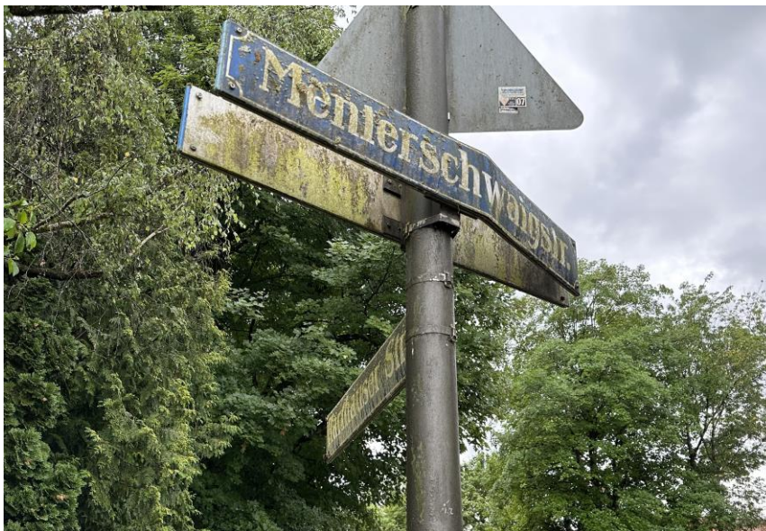
Beispiel eines Schildes: Ecke Harthäuser Str. / Menterschwaigstraße

Anbei ein Beispiel eines Straßenschildes an der Ecke Harthäuser Straße / Menterschwaigstraße.