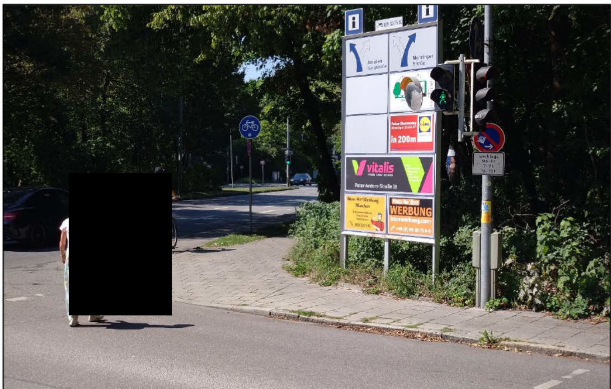
Abb. 6: Ansicht Kreuzungsbereich Schragenhofstr. und Allacher Str.