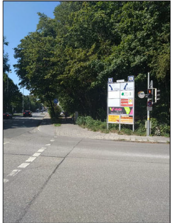
Abb. 5: Ansicht Allacher Str. in Richtung Westen/stadtauswärts hinweg über die Einmündung der Schragenhofstr.