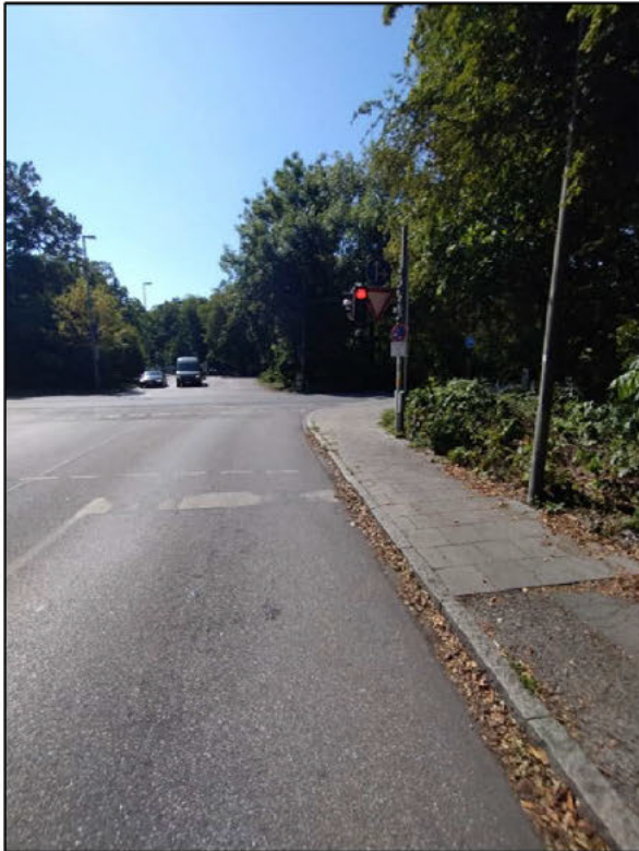
Abb. 4: Ansicht Ampelanlage südl. Ende Schragenhofstr. zu Allacher Str.