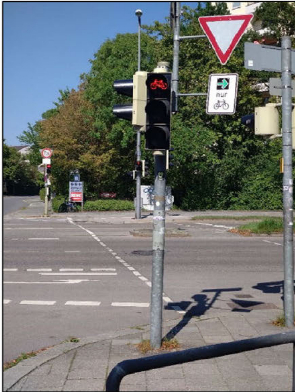
Abbildung 1: Grünpfeil Pirschstr. zu Allacher Str.