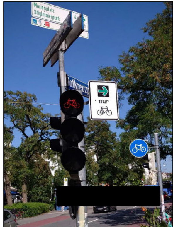
Abbildung 2: Grünpfeil Wendl-Dietrich Str. zu Leonrodstr.