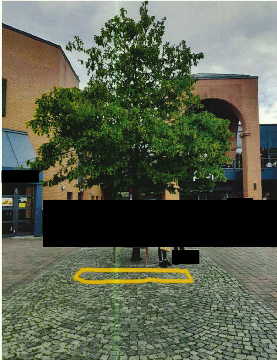
PEP - Standort 2