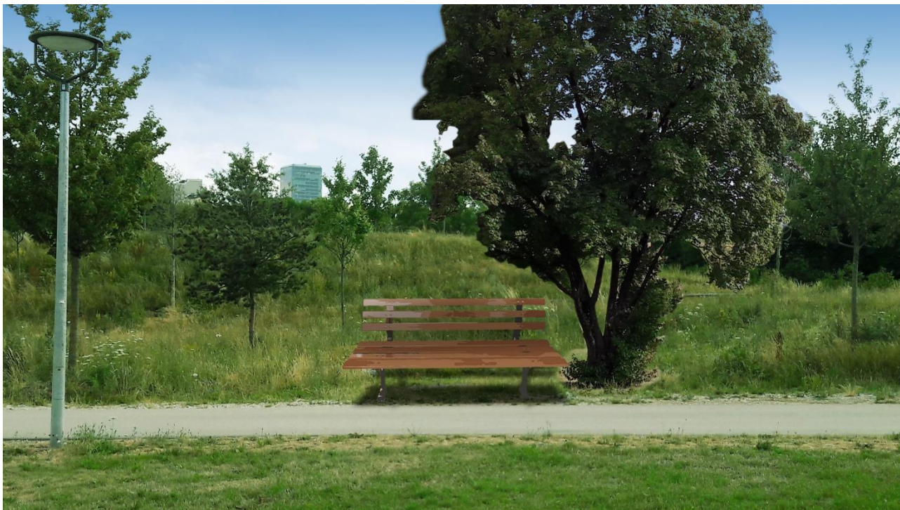
Foto 5 mit Fotomontage (Blickrichtung nach Süden): Standortvorschlag für zusätzliche Bank nahe Ballspielplatz (plus Symbol-Baum)