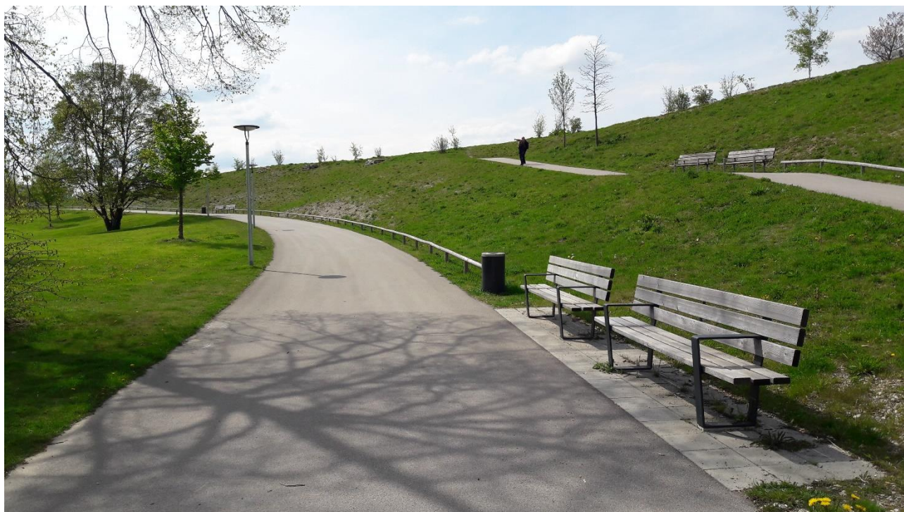
Foto 1: Ist-Zustand - Alle Sitzbänke, mit Ausnahme der vordersten, stehen schattenlos in der Sonne, nicht nur hier, sondern auch im übrigen Areal der Grünanlage Am Oberwiesenfeld.