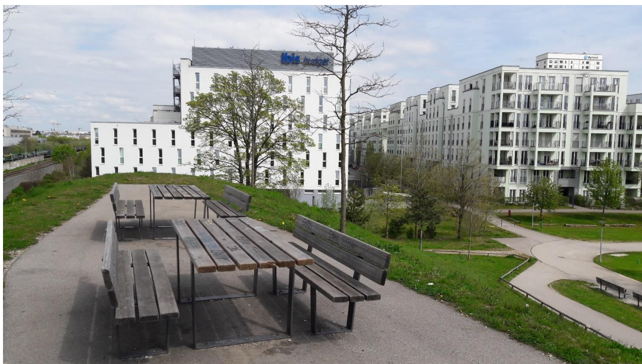
Foto 2: Meist stark frequentierte Bank-Tisch-Kombinationen auf dem Gipfel des Aussichtsbirges.

Alle Fotos von Leo Meyer-Giesow im April 2023 aufgenommen.