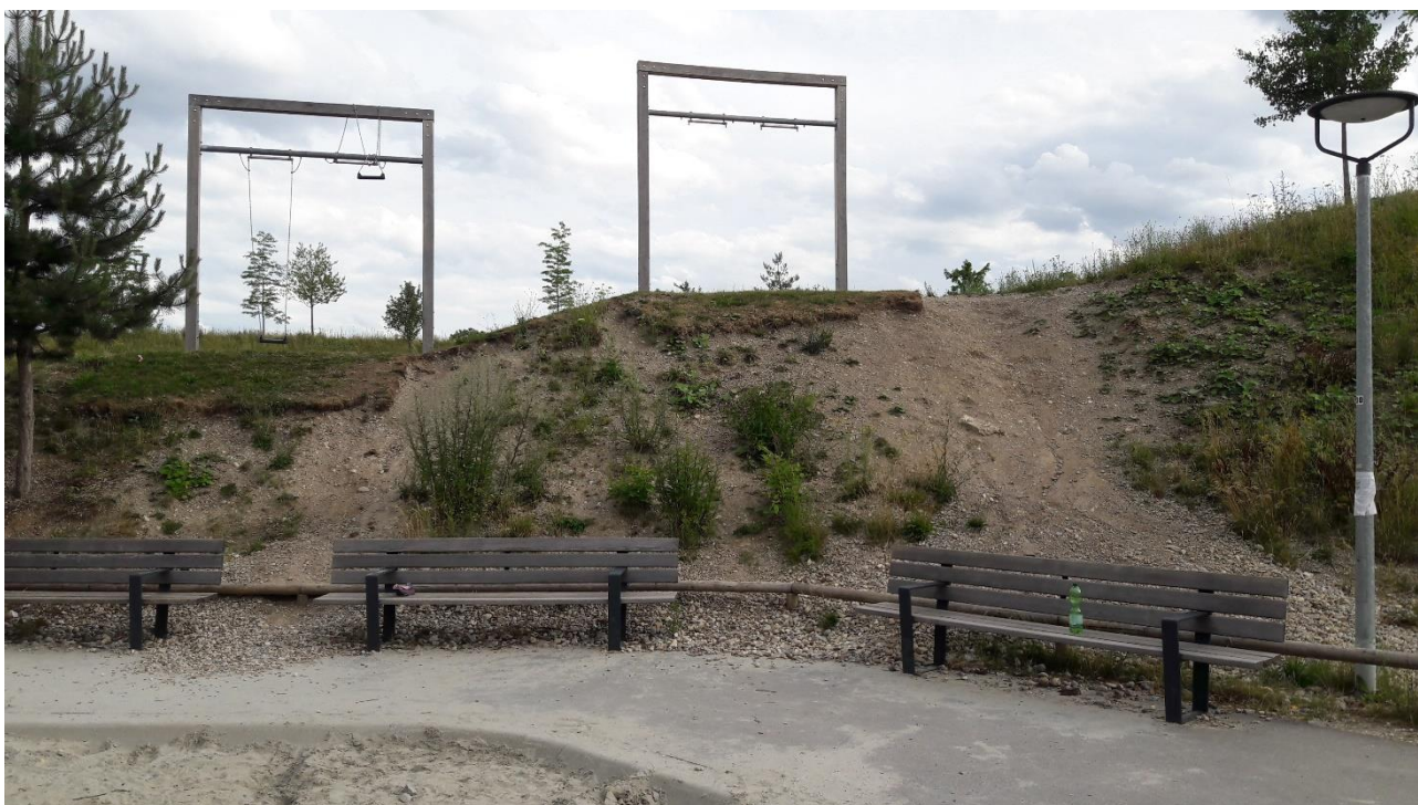
Foto 6 (Blickrichtung nach Süden): Sitzbänke am Kinderspielplatz – Im Zuge der ohnehin geplanten Wallsanierung sollten hier hinter ein oder zwei Bänken schattenspendende Gehölze gepflanzt werden.