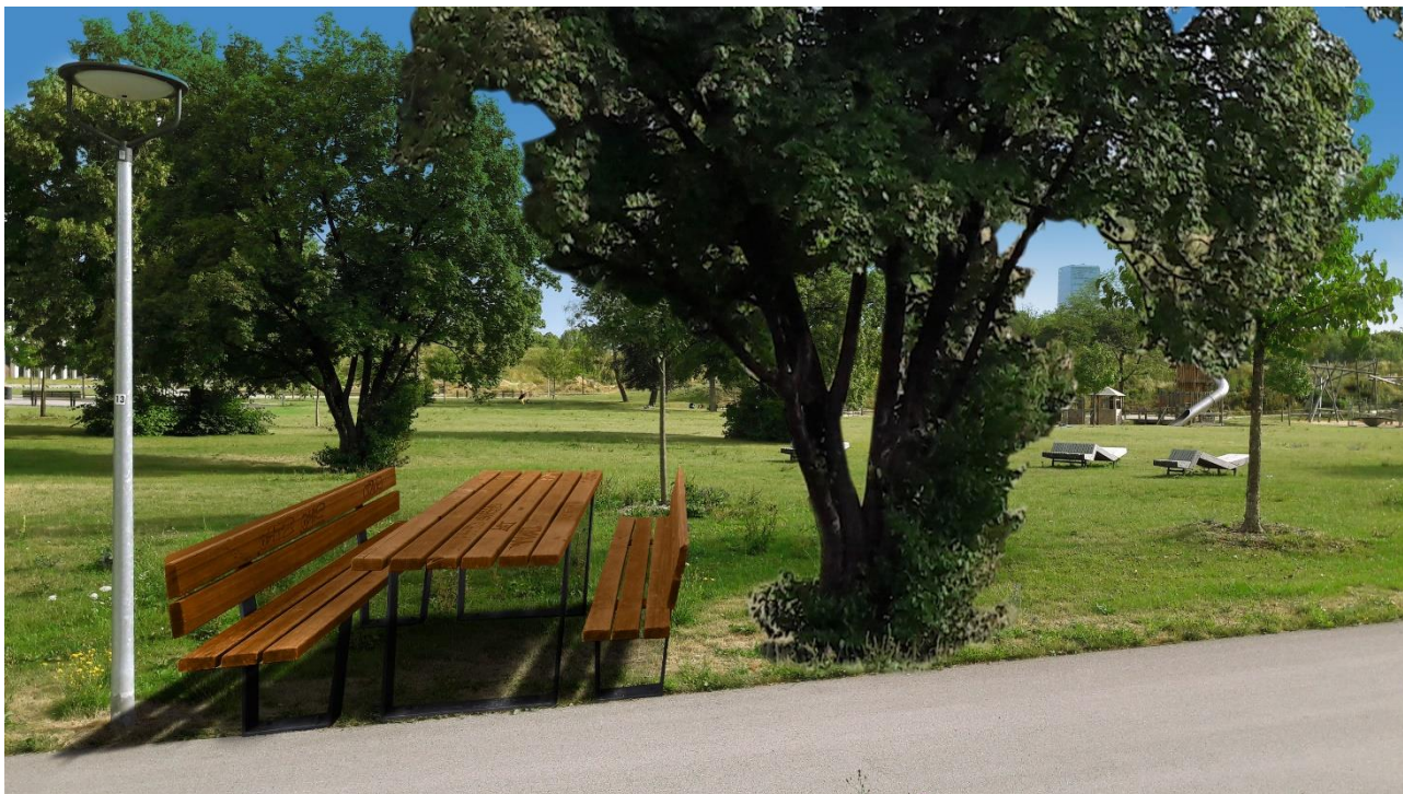
Foto 3 mit Fotomontage: Standortvorschlag für zusätzliche Bank-Tisch-Kombination neben Laterne 13, im ruhigeren Teil des Parkes südlich vom Aussichtsbereich (plus Symbol-Baum)