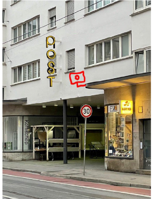
Stadtauswärts Höhe ehemalige Post