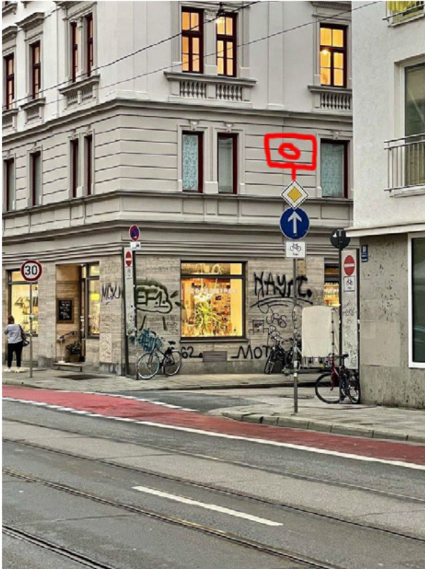
Stadtauswärts Höhe Jahnstr.