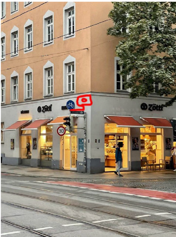
Stadtauswärts Höhe Klenzestr.