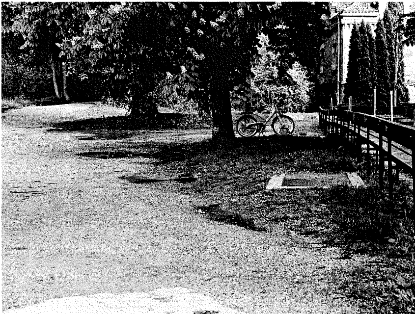
Heutiger Zustand. Der Bachlauf ist verrohrt.