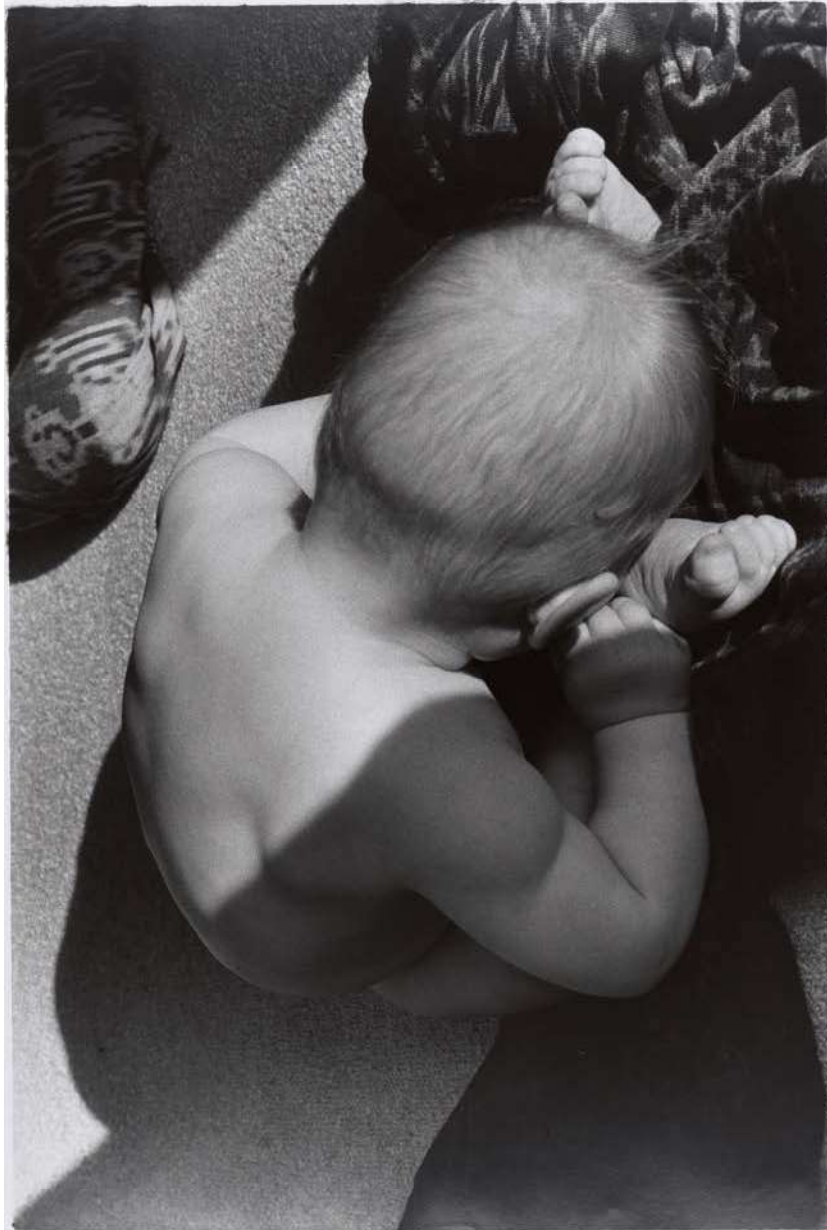
Silke Grossmann ,Hände und Füße“ (Alwin Baby) Süllbergstraße Hamburg, 2005/1990 Höhe x Breite 50 x 60 cm