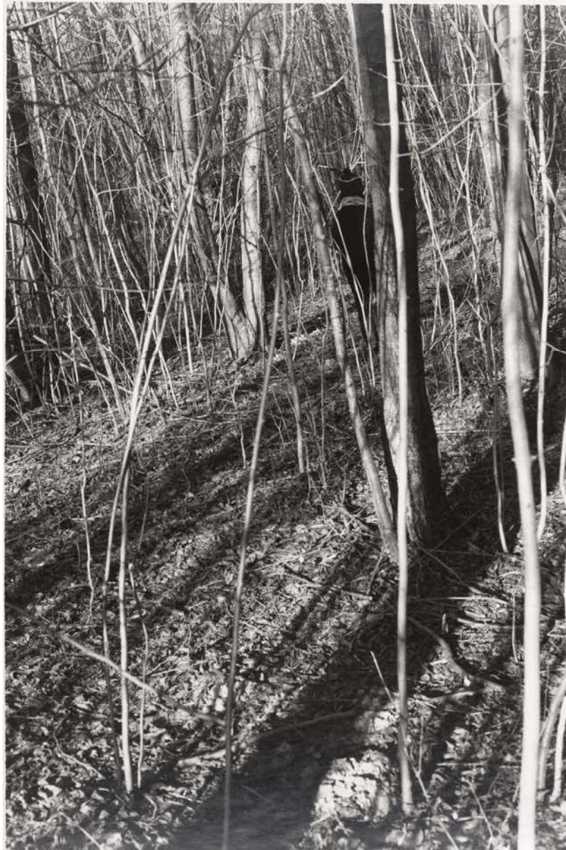
Silke Grossmann Doppelbild „Weißes Moor I“ (A. im Wald) Schaalsee, 2005/1998 Höhe x Breite 50 x 60 cm