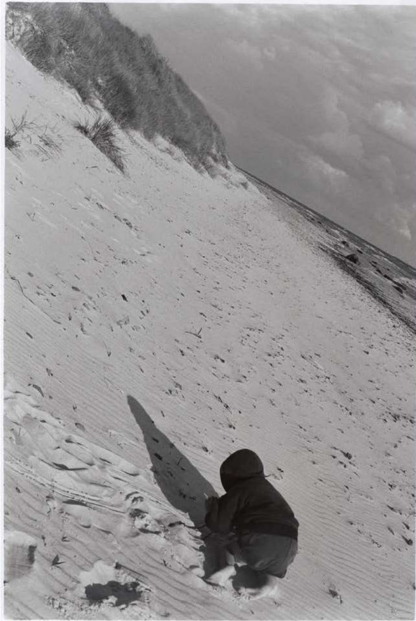
Silke Grossmann Doppelbild „Sommerodde“ (A. am Strand) Bornholm, 2005/1995 Höhe x Breite 50 x 60 cm