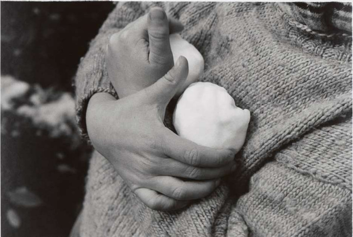
Silke Grossmann ,Schneebälle“ Hamburg-Blankenese, 2001/1995 Höhe x Breite 50 x 60 cm