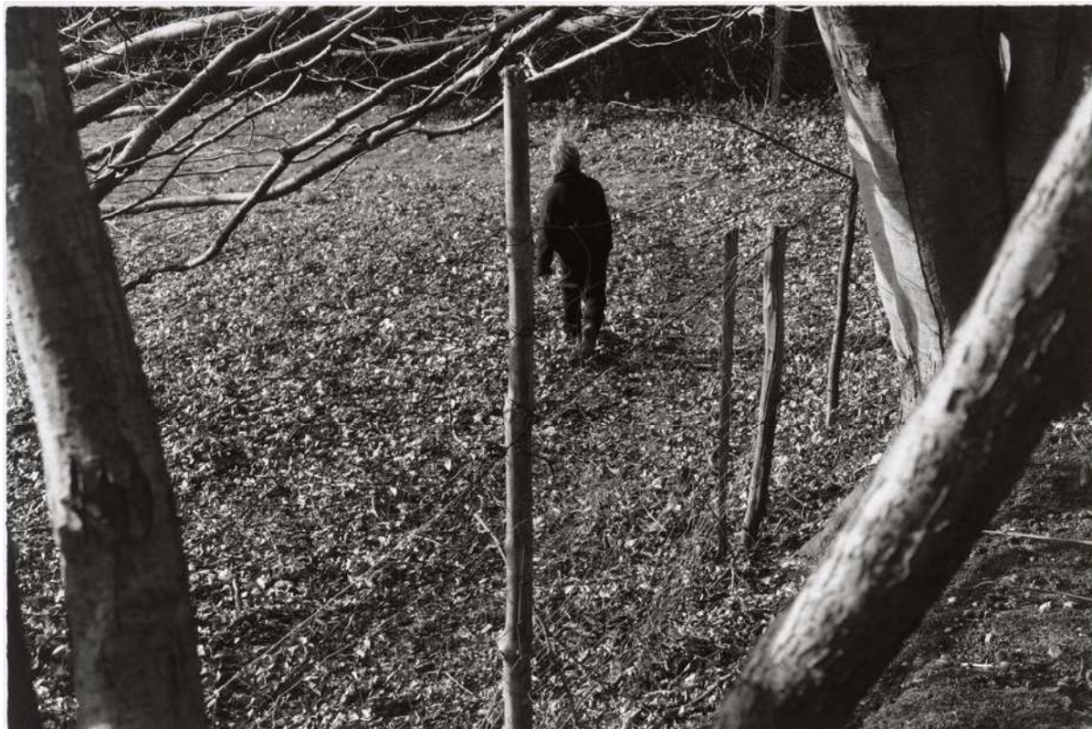
Silke Grossmann „Rachut“ (Garten Waldrand) Malente, 2005/1997 Höhe x Breite 50 x 60 cm