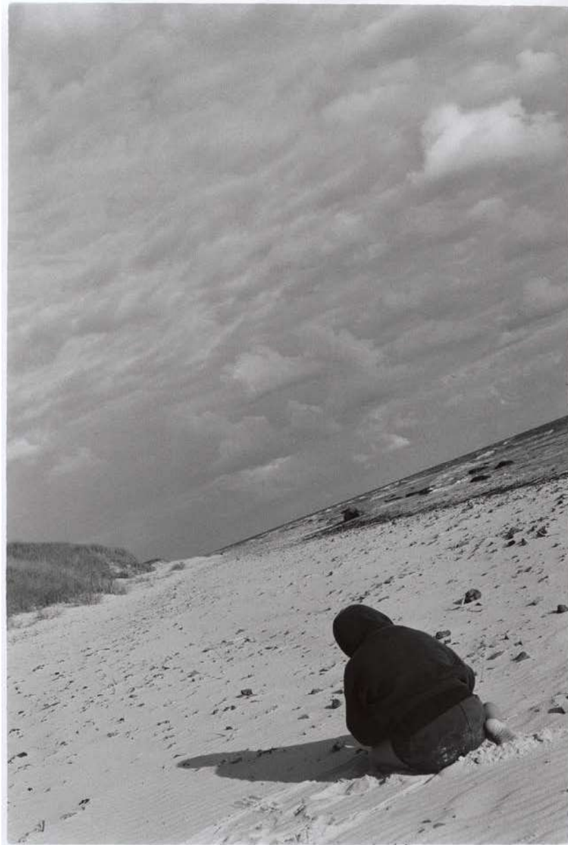
Silke Grossmann Doppelbild „Sommerodde“ (A. am Strand) Bornholm, 2005/1995 Höhe x Breite 50 x 60 cm