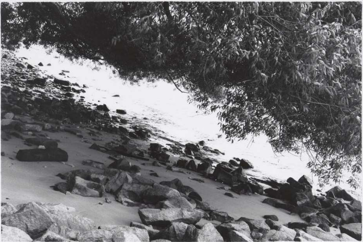
Silke Grossmann „Elbufer“ Hamburg-Blankenese, 2005/1991 Höhe x Breite 30 x 40 cm