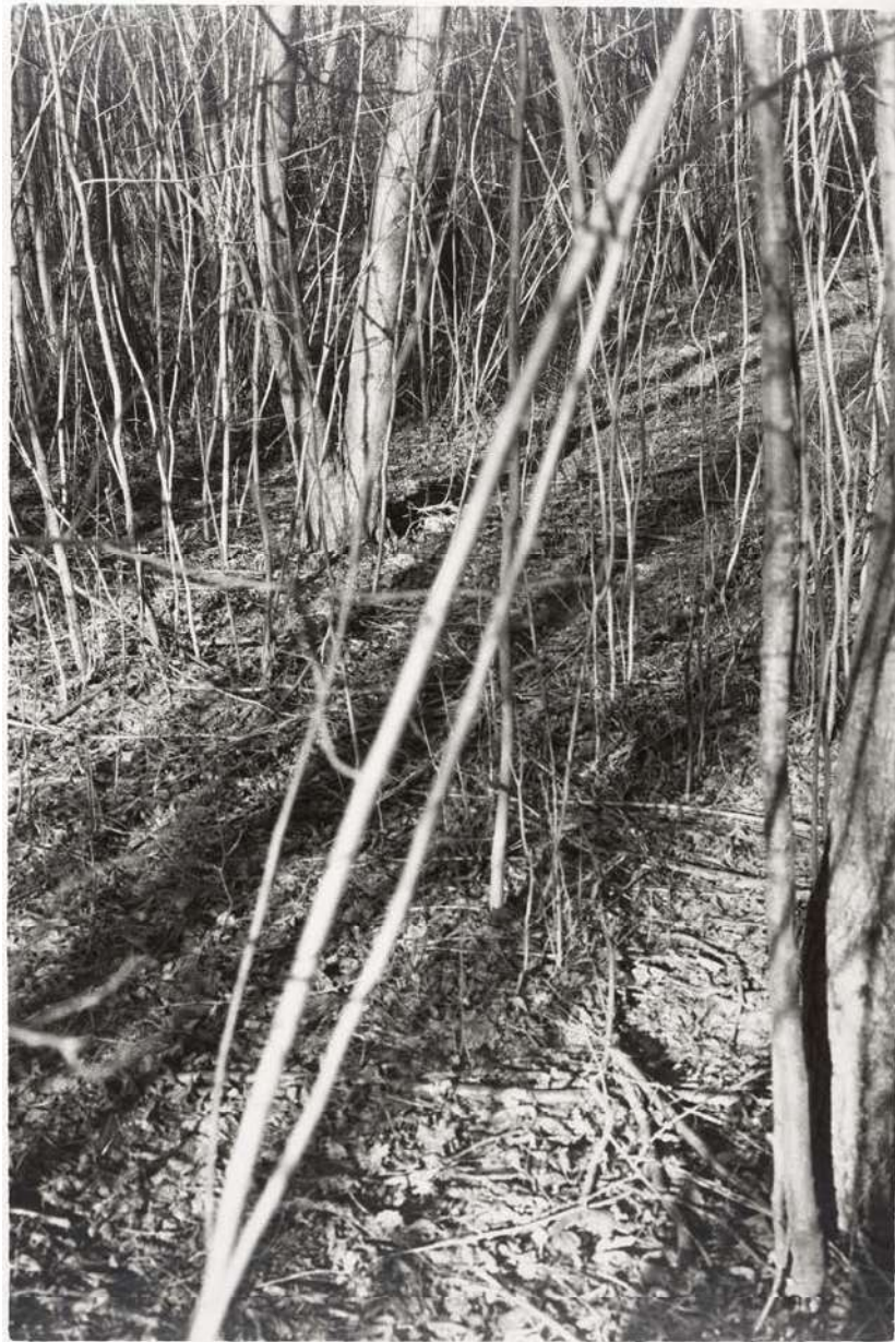
Silke Grossmann Doppelbild „Weißes Moor I“ (A. im Wald) Schaalsee, 2005/1998 Höhe x Breite 50 x 60 cm