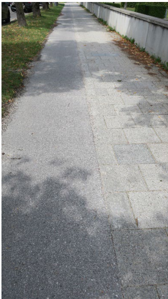
Bild 1: Verblasster Begrenzungstreifen Agnes- Bernauer-Straße Nordseite

Auch wenn auf lange Sicht ein Farbbelag der Radwege das Optimum darstellt, erscheint die Aufbringung weißer Trennstriche als vergleichsweise kostengünstige und leicht zu realisierende Möglichkeit, die Erkennbarkeit zu erhöhen und damit die Sicherheit vor allem des Fußverkehrs zu erhöhen. Daher wird die Stadtverwaltung auch um Prüfung gebeten, ob die Einführung des weißen Begrenzungstreifens im Sinne dieses Antrages grundsätzlich auch für weitere Straßenbereiche im Stadtgebiet in Frage kommt.