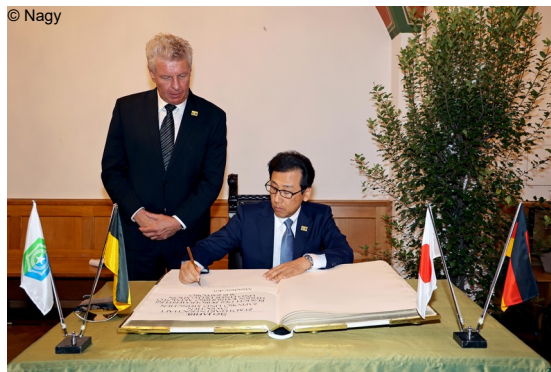
Abb. 13: Bürgermeister Akimoto aus Sapporo trägt sich in das Goldene Buch der Stadt München ein