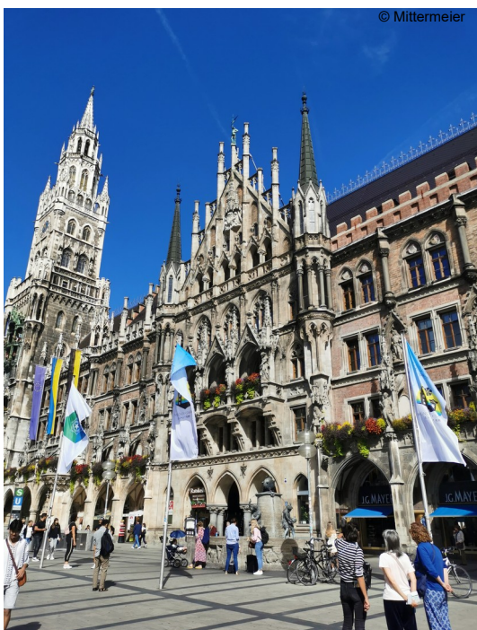
Abb. 11: Jubiläumseinfahrt am Marienplatz