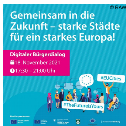
Abb. 5: Infos zum Bürgerdialog

Anschließend konnten sie ihre Ideen und Fragen direkt den politischen Vertreter*innen beider Städte präsentieren: Katrin Habenschaden, 2. Bürgermeisterin der Landeshauptstadt München, und Céline Papin, stellvertretende Bürgermeisterin der Stadt Bordeaux, diskutierten mit ihnen die Vorschläge und mögliche Umsetzungen. Die Hauptthemen des Abends waren nachhaltige Mobilität, Klimaschutz und Digitalisierung. Die Ergebnisse des Dialogs sollen als Grundlage für die Umsetzung konkreter Maßnahmen in München und Bordeaux dienen, die sich an den Bedürfnissen und Erwartungen der Bürger*innen orientieren. Er ist darüber hinaus ein Schritt, um den Austausch von Best Practices zwischen den Partnerstädten zu stärken.