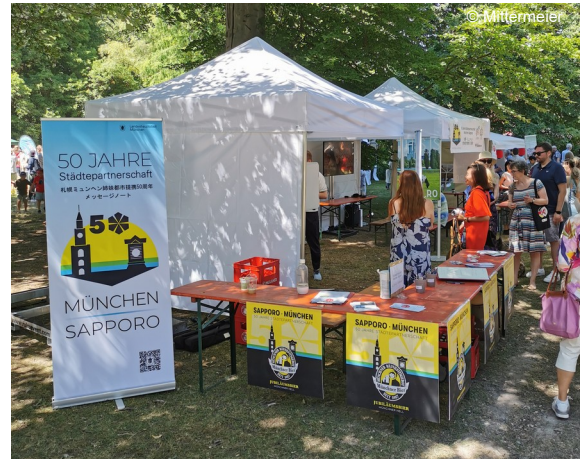
Abb. 10: Sapporo-München-Stand am Japanfest