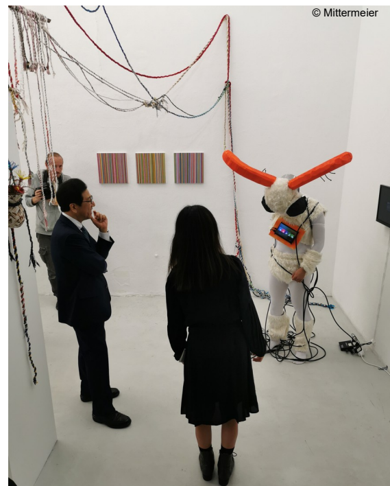
Abb. 12: Einer von vielen Terminen der Delegation aus Sapporo, hier bei einer Ausstellung von Künstlerin aus Sapporo und München in der Artothek