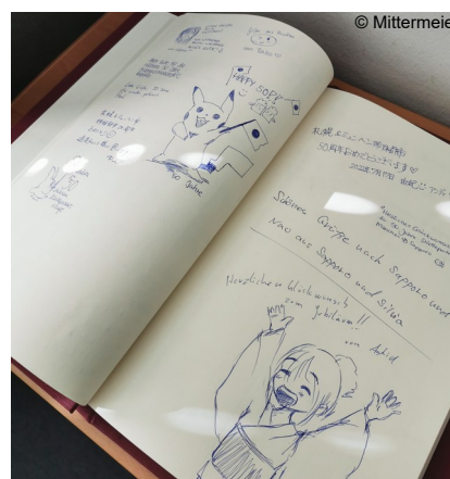
Abb. 8: Gästebuch