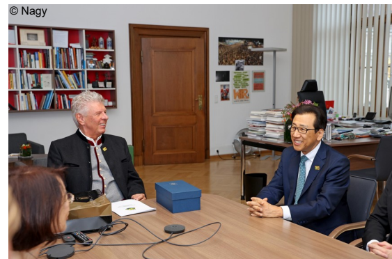
Abb. 14: Welcome-Meeting im Oberbürgermeister-Büro