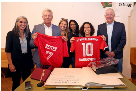
Abb. 3: Eintragung Goldenes Buch und Geschenkübergabe

Als Vorschau für das Folgejahr werden bereits erste Bilder vom Delegationsbesuch aus Be'er Sheva vom Juli 2022 gezeigt: