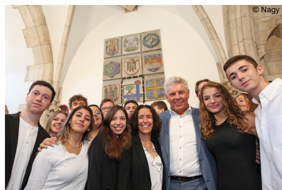
Abb. 4: Stadtwappenenthüllung