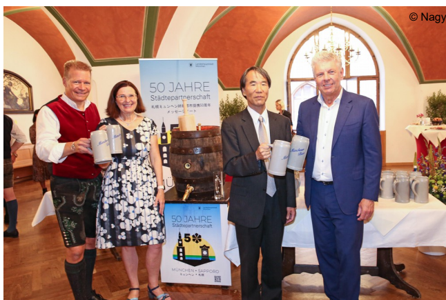
Abb. 7: Bierprobe in der Ratstrinkstube

Als Vorschau für das Folgejahr werden bereits erste Bilder aus dem Jubiläumsjahr 2022 mit Sapporo gezeigt: