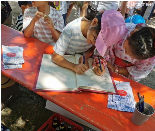
Abb. 9: Gästebuch am Japanfest