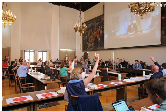
Abb. 1: Beschlussfassung im VPA am 21.07.2021