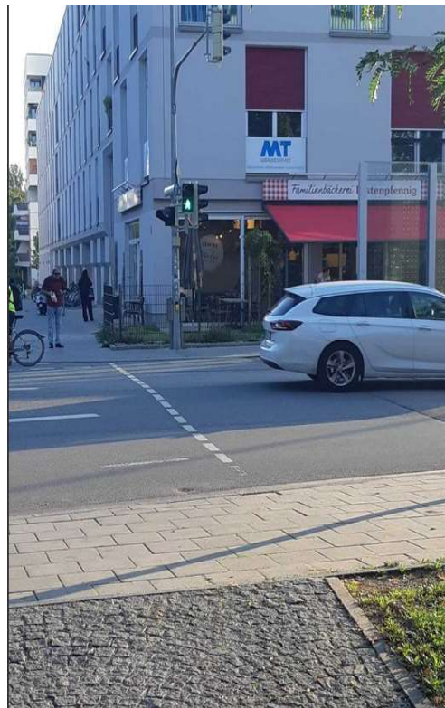
Die Sichtbeziehungen auf die signalgesicherte Querungsstelle ist ohne jede Beeinträchtigung.