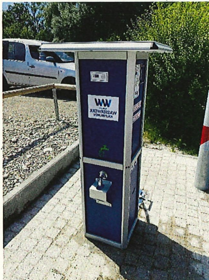
(Entsorgungsstation der Wasserwerke Kaufbeuren)

Hierfür sollen - aufgrund der optimalen Infrastruktur - insbesondere größere Parkplätze (Norden, Süden, Westen, Osten) im Zusammenhang mit der Möglichkeit einer Ausweisung als Nachtstellplätze geprüft werden. Teil des Konzepts soll eine möglichst kostendeckende Gebührenstruktur sein. So wird anderenorts bspw. 1 bis 2 Euro pro 100 Liter Frischwasser, 0,50 bis 1 Euro für das Entsorgen der Chemietoilette oder 10 Euro für das Nachtparkticket durchreisender Fahrzeuge verlangt.