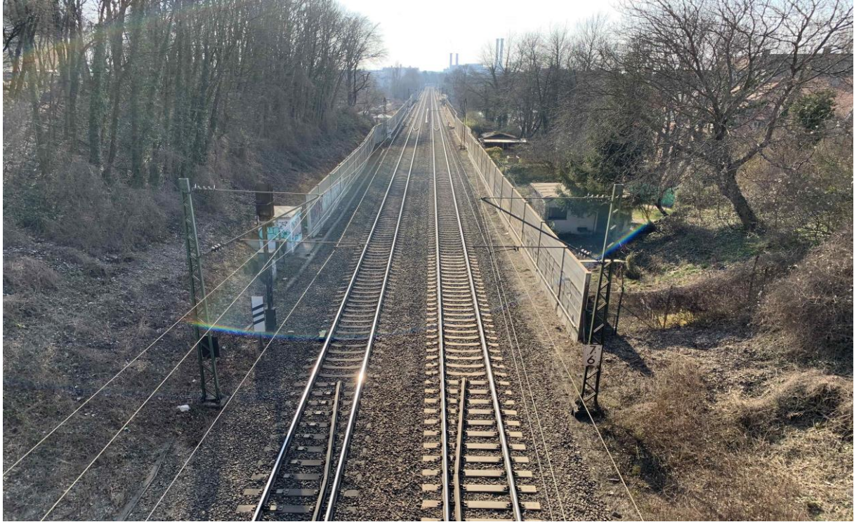
Foto der Stelle vom Schmederersteg aus