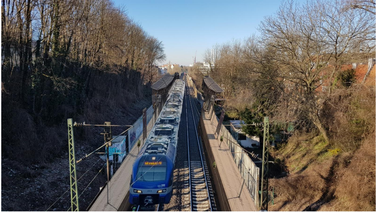
Visualisierung des Regionalzughalts mit zwei Bahnsteigen (Toni Reitz)

Eine Gleiserweiterung ist hierfür nicht nötig, die Zugtaktung auf dem Südring ist kompatibel mit den Ein- und Ausstiegszeiten an der Haltestelle. Baumfällungen wären nicht notwendig für die Realisierung des Provisoriums. Durch Verzicht auf Betonkonstruktion könnte eine klimafreundliche Baumaßnahme umgesetzt werden.