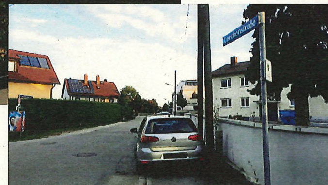
Standortbeispiel für Zone 30 Schild