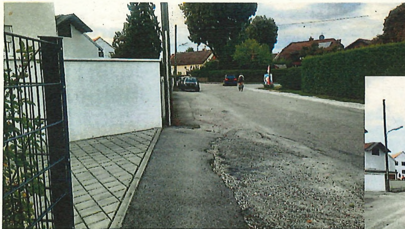
Blick nach Norden Höhe Lerchenstr. 121-123 (linke und rechte Straßenseite)