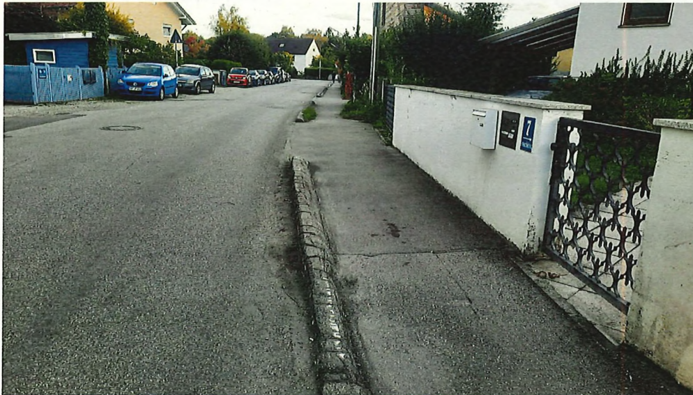
Provisorische Gehwegbegrenzung Schwarzhölzlstraße, Feldmoching