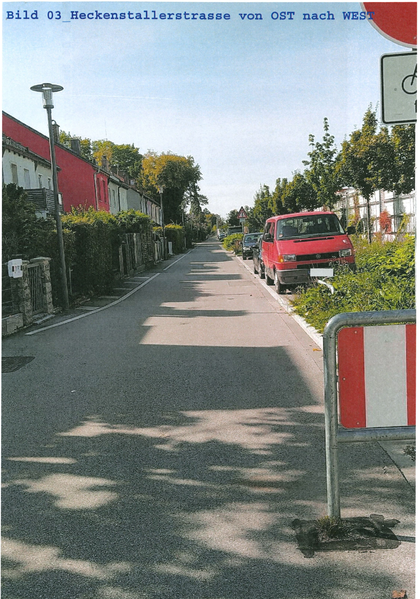
Bild 03_Heckenstallerstrasse von OST nach WEST