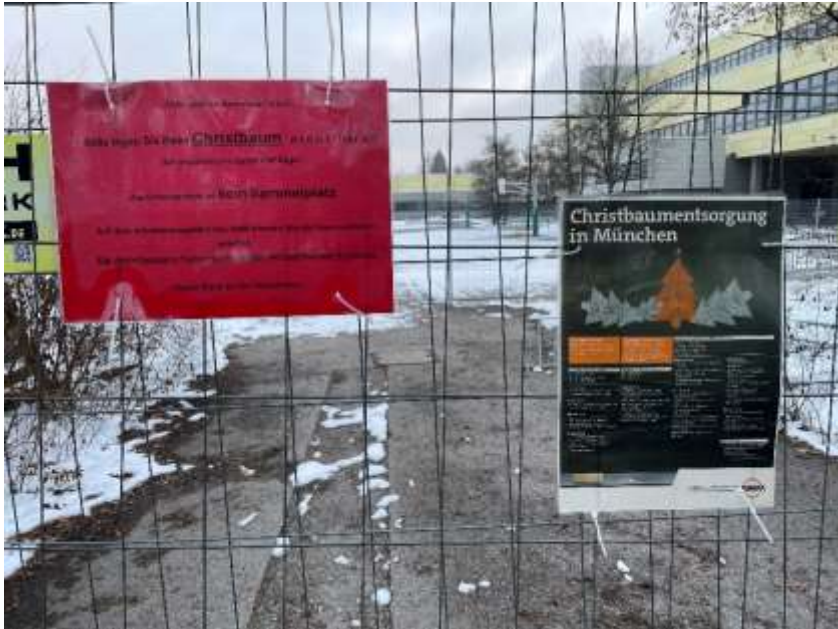
Bild 2: Der Haufen ist entstanden, obwohl Schilder auf die korrekte Christbaumentsorgung hinweisen und das Ablegen an dieser Stelle verbieten.