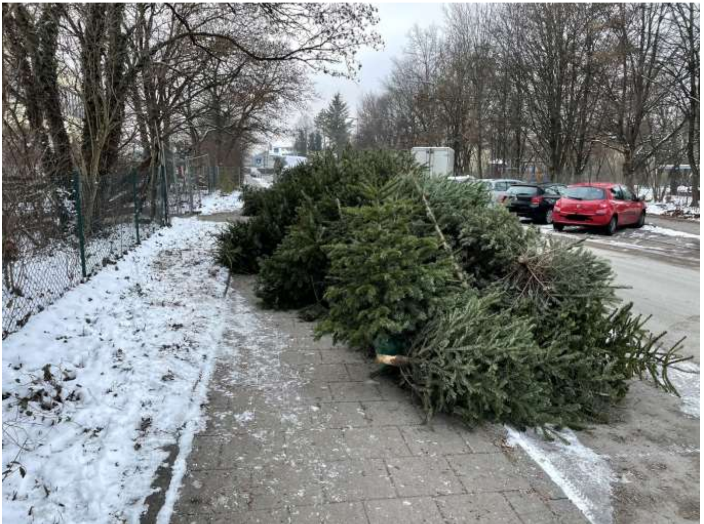
Foto 1: Ein großer Christbaumhaufen versperrt den Fußweg in der Merseburger Straße (aufgenommen am 10.01.2021)

Die unten anfügten Fotos verdeutlichen die Situation.