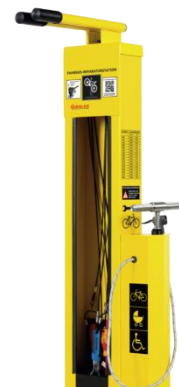
Abbildung 1: Fahrradservicestation beispielhaft

Der zunehmende Fahrradverkehr braucht nicht nur gute und sichere Wege sondern auch ergänzende Infrastruktur um alle Fahrten angenehm zu gestalten. Bei Pannen ist es in München zwar meist nicht weit zum nächsten Fahrradladen, die dankenswerter Weise oft Luftpumpen bereitstellen, aber ob der dann gerade geöffnet hat oder Zeit hat eine Schraube nachzuziehen ist fraglich.