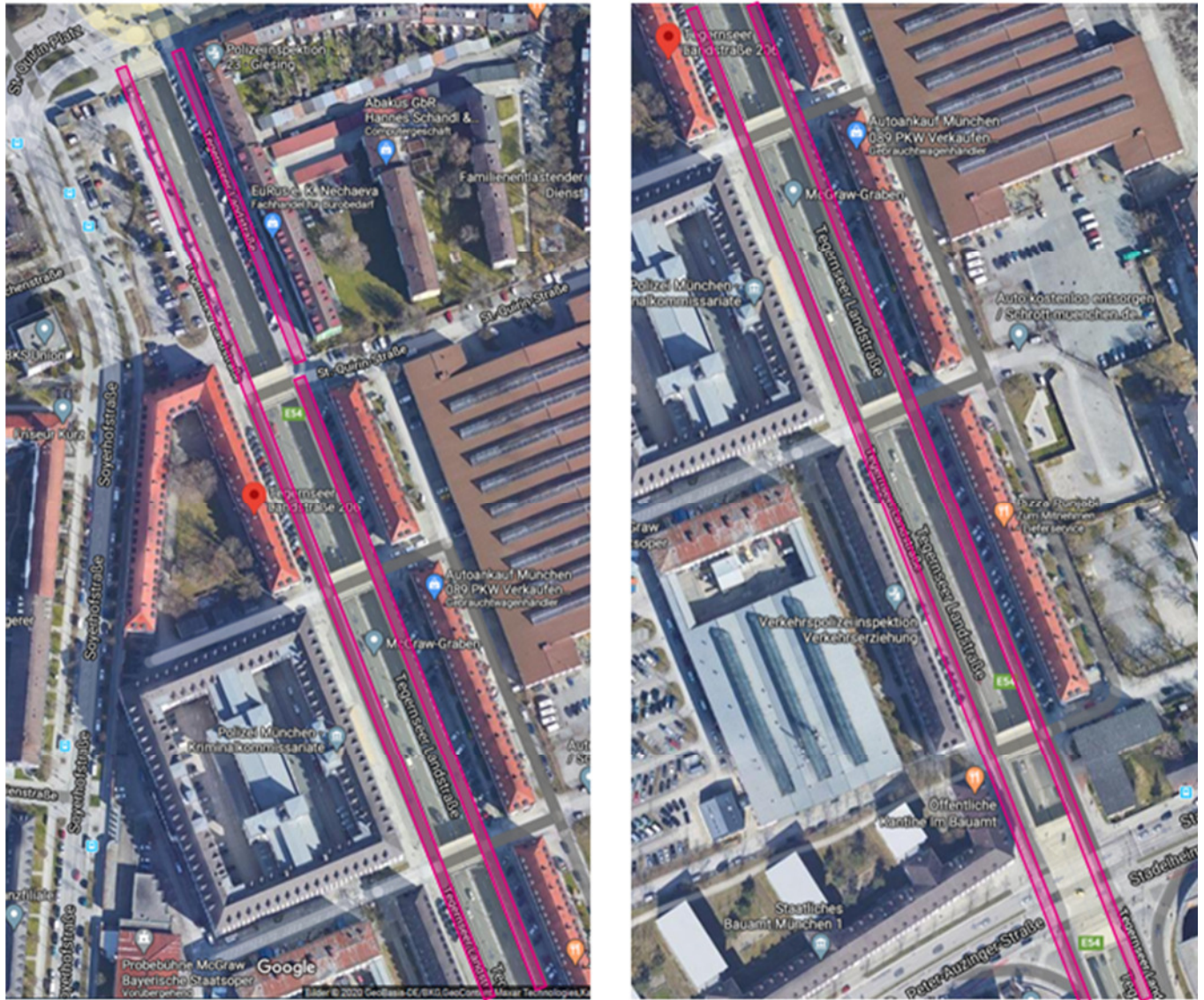
Abb. 1: Fahrspur am oberen Rand des McGraw-Grabens (lila Markierung)