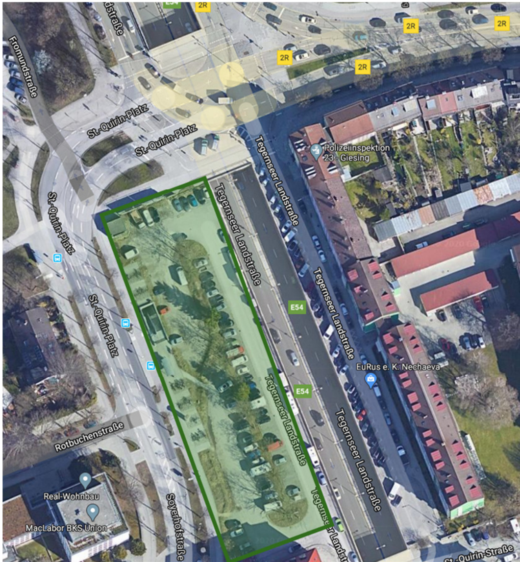
Abb. 2: Umzugestaltende Fläche am Sankt-Quirin-Platz (grüne Markierung)