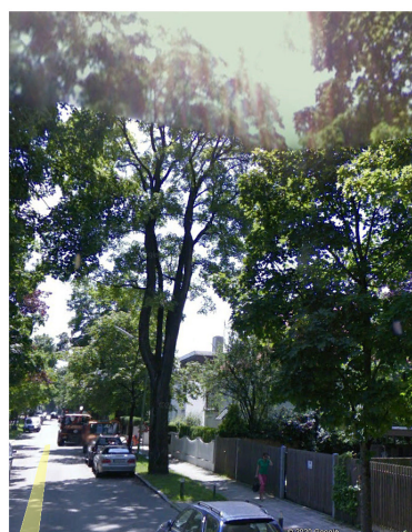
Geiseltagestr. 26, Spitzahorn, 240cm Umfang

CSU Fraktion im BA 18 Untergiesing- Harlaching