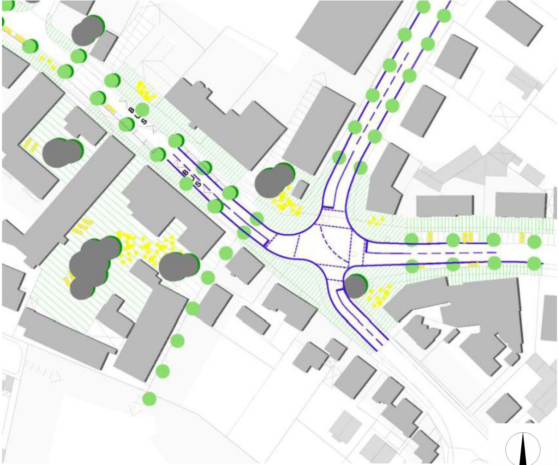
Abbildung: Ausschnitt Präsentation Bürgerwerkstatt (Plankreis und CIMA im Auftrag der MGS mbH und LHM)

Eine erneute Informationsveranstaltung zur Sanierung fand am 16.04.2015 statt. Dort wurden die Ergebnisse der verkehrlichen Untersuchungen ausführlich vorgestellt und zu Fragen Stellung bezogen. Mit Beschluss des Bauausschusses vom 14.07.2015 (Sitzungsvorlage Nr. 14-20 / V 03393) wurde das Baureferat beauftragt, die Entwurfsplanungen in die Wege zu leiten. Die Reduzierung der Abbiegespuren in der Truderinger Straße als auch an den Knotenpunkten zur Bajuwarenstraße und dem Schmuckerweg wurden in diesem Beschluss thematisiert und mehrfach erwähnt. Den Abschluss dieser Veranstaltungen stellte die Einwohnerversammlung am 16.04.2018 dar, in der die Inhalte des Gestaltungswettbewerbs erörtert wurden. Parallel dazu konnten und können sich die Betroffenen der Sanierungsmaßnahmen in dem von der MGS eingerichteten Stadtteilbüro über Inhalte und Sachverhalte des ISEKs und der verkehrlichen Untersuchungen informieren lassen.